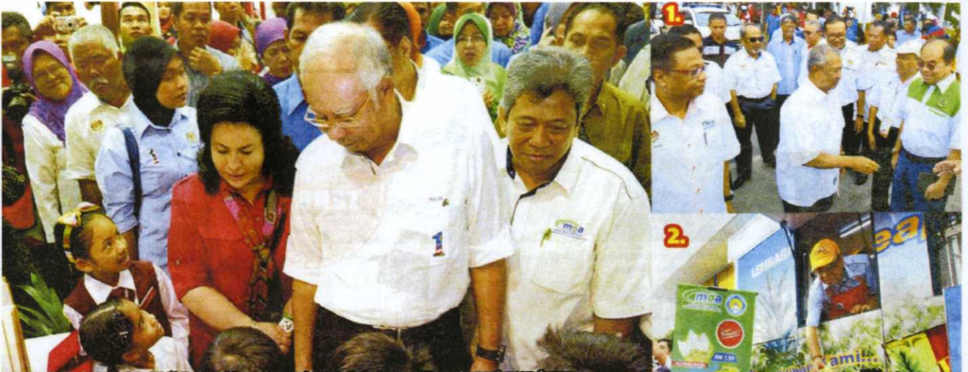
PERDANA Menteri, Datuk Seri Najib Tun Razak bersama-sama isteri, Datin Seri Rosmah Mansor beramah mesra dengan kanak-kanak selepas menyempurnakan Majlis Perasmian MAHA & HPPNK 2014 di MAEPS, Serdang.